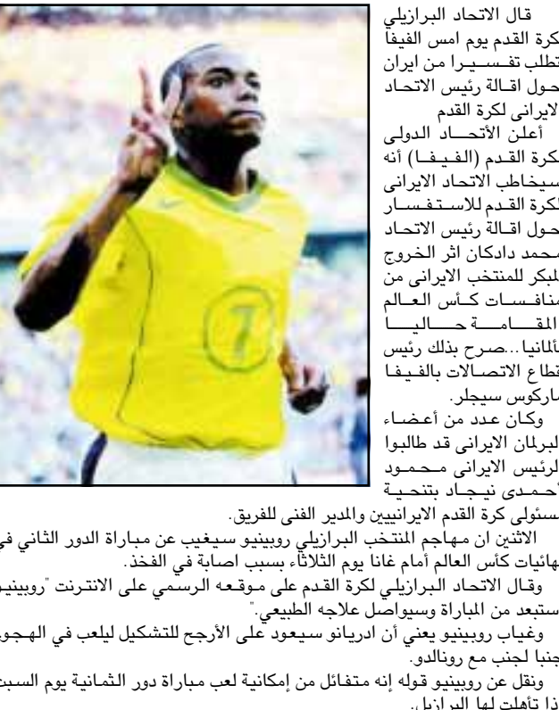
Koora.com