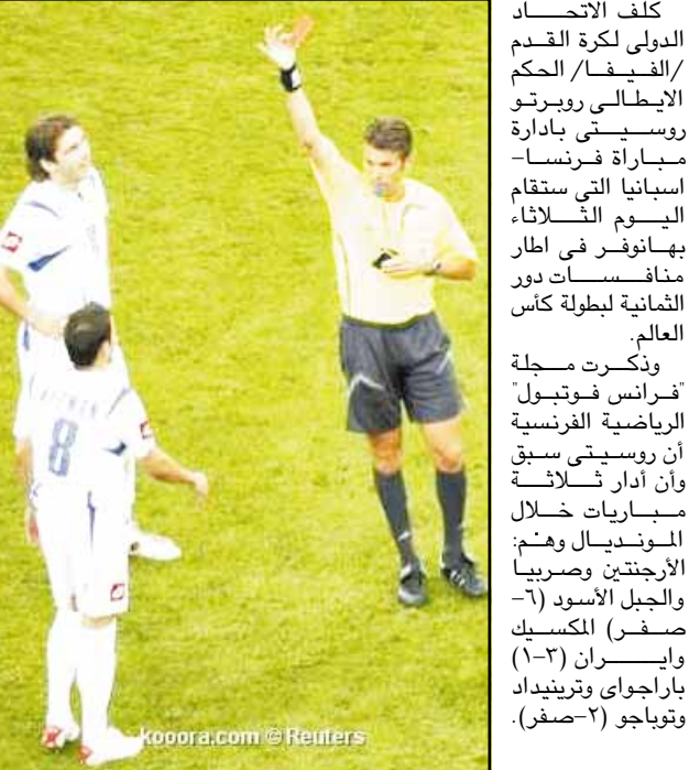
Koora.com © Reuters