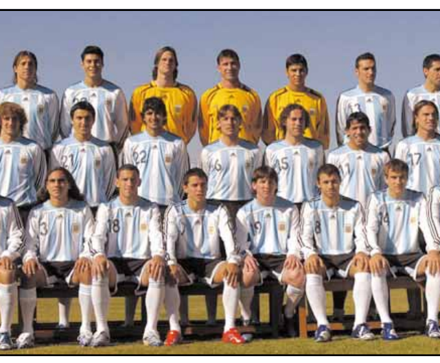
ان هدف المنتخب الأرجنتيني جاء من مكان يصعب التسجيل منه. وأضاف لانولبي «هناك بالطبع أشياء أخرى (افتقداها). ولكنني أعتقد أننا كنا على قدم المساواة في التنافس معهم».

قال خوسيه بيكرمان المدير الفني للمنتخب الأرجنتيني لكرة القدم إنه سعيد بتأهل المنتخب إلى دور الثمانية من نهائيات كأس العالم رغم أن الفريق لم يحرز عددا كافيا من الأهداف في مباراته أمام نظيره المكسيكي. وأوضح بيكرمان إنه كان يتوقع دائما أن المباراة ستكون صعبة. وقال «المنتخب المكسيكي فريق قوي للغاية ونحن عرفنا ذلك. ولم نخش المباراة ونحن معتقدون أنها ستكون سهلة». وأضاف بيكرمان «إنني أدرك أننا نعاني من بعض المشكلات في التعامل مع الكرات المرتفعة. وعندما نتغلب على هذه المشكلات سيكون الأمر أكثر سهولة». وأشار بيكرمان إلى أن عدم تسجيل فريقه أهدافا عندما كان مسيطرا على المباراة يبدو مشكلة. وقال «كانت هناك فترة في المباراة كنا فيها أكثر استحوادا على الكرة. انا قلق لنا لم نسجل خلال هذه الفترة. وهو الشيء الذي نحتاج العمل من أجل حله». واعترف رودريجز بأن التسديدة الصاروخية التي أحرز منها هدف الفوز ٧/٢ كانت عشوائية وأن الكرة ربما كانت تنطلق في المرحلات ولكنها لحسن الحظ سكنت الرمي المكسيكي. وقال رودريجز «بعد الهدف أصبحت الأمور أكثر سهولة بالنسبة لنا. ثم هدانا لفترة وهذا كان في مصلحتنا ولم تكن هناك صعوبة بعد ذلك». وقال ريكاردو لانولبي المدير الفني للمنتخب المكسيكي إنه يعتقد أن فريقه أظهر للعالم كله خلال هذه البطولة أنه قادر على لعب كرة قدم جيدة ويمكنه التنافس مع أفضل الفرق في العالم. وقال لانولبي «ما كنا نفتقد في المباراة أمام الأرجنتين هو حسن الحظ. وهو الشيء الذي يحتاجه الفرد كي ينجح ونحن لم نجد ذلك». وأشار إلى