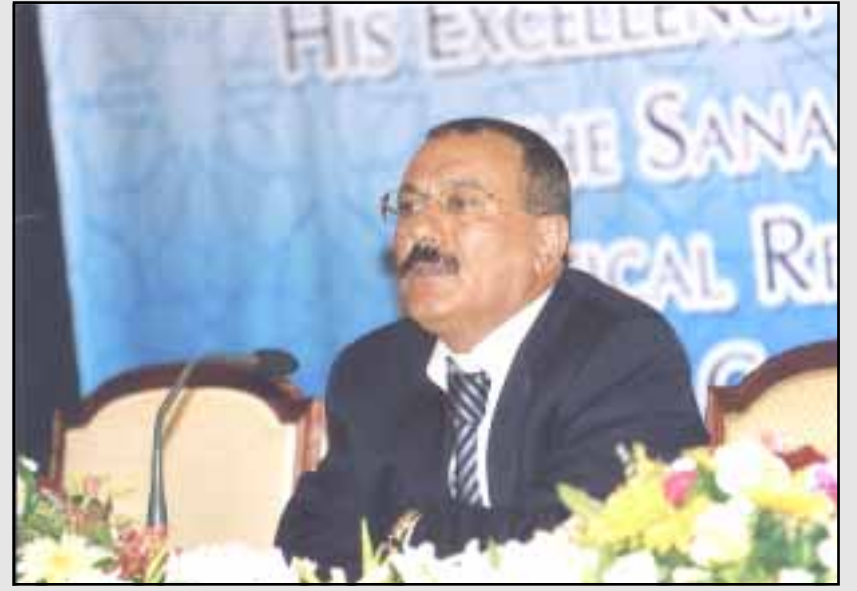
صنعاء / سبا

حضر فخامة الأخ الرئيس علي عبدالله صالح رئيس الجمهورية الجلسة الافتتاحية لمؤتمر صنعاء حول الديمقراطية والإصلاح السياسي وحرية التعبير الذي بدأ أعماله أمس بصنعاء بمشاركة ٤٠٠ شخصية عربية ودولية. وقد ألقى الأخ الرئيس كلمة رحب في مستهلها بالاشقاء والأصدقاء المشاركين في هذا المؤتمر. وقال إن العصر هو عصر الديمقراطية ولا مفر من الديمقراطية وينبغي لنا أن نأخذ بالتجارب الناجحة والجيدة للشعوب المتقدمة في هذا المجال. وأضاف ينبغي أن تستفيد الشعوب النامية من تجارب الدول الديمقراطية وعليها ألا تكابر في هذا الجانب فالعصر عصر الديمقراطية.