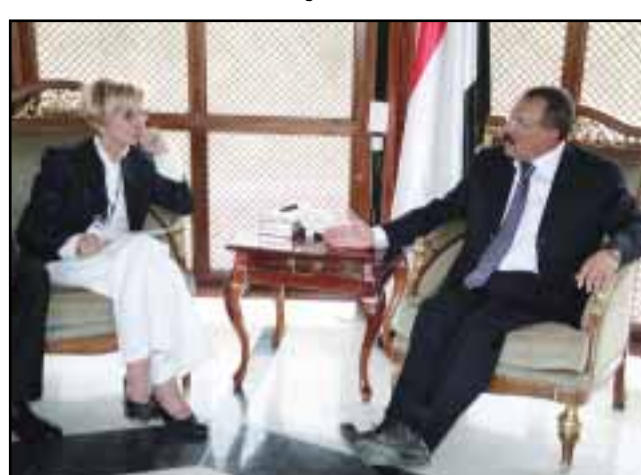
صنعاء / سبا عبد الله صالح رئيس الجمهورية السيد / إيمان بونينو / وزيرة التجارة الخارجية الإيطالية رئيسة وفد إيطاليا لمؤتمر صنعاء حول الديمقراطية وحرية التعبير والتي قامت بنقل رسالة إلى فخامة الأخ رئيس الجمهورية من فخامة الرئيس / جورجيو نانوليتانو / رئيس الجمهورية الإيطالية تناولت العلاقات الثنائية والتعاون المشترك بين البلدين وسبل تعزيزها. وأكد فخامة الرئيس الإيطالي في رسالته حرص إيطاليا على تعزيز روابط الصداقة الطويلة بين اليمن وإيطاليا والعمل معاً لما فيه خدمة السلام والاستقرار في المنطقة. وجرى خلال اللقاء، تناول القضايا والموضوعات التي يجري مناقشتها في مؤتمر صنعاء حول الديمقراطية والإصلاحات السياسية وحرية التعبير والسبل الكفيلة بإنجاح هذا المؤتمر وما من شأنه تعزيز الحوار بين الحكومات ومنظمات المجتمع المدني. وقد أشادت السيدة / بونينو / برعاية اليمن لهذا المؤتمر وغيره من الوفود الباكستاني إلى مؤتمر صنعاء.