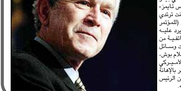
واشنطن / وكالات: قدم الرئيس الأميركي جورج بوش، اعتذاراً لصحافي ضير بعدما سخر منه لارتدائه نظارة شمسية، في مؤتمر صحفي.