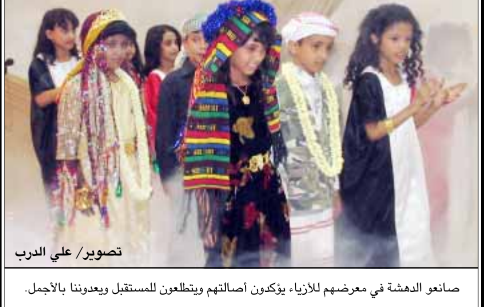
صانعو الدهشة في معرضهم للأزياء، يؤكدون أصالتهم ويتطلعون للمستقبل ويعدوننا بالأجمل.