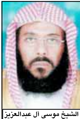
الشيخ موسى آل عبدالعزيز

دعا فقيه وداعية إسلامي سعودي إلى تقليل تدريس المناهج الدينية في السعودية وتعديل محتوى ما يتم تدريسه من الفقه، قائلاً إننا لا نريد إنتاج مجتمع (طالباني) أو (رهباني) أو مجتمع متدين مائة في المائة، ولا نريد كثرة من الشائعات والفراء، بل مجتمعاً إسلامياً مديناً.