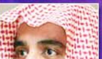
صالح بن عبدالعزيز آل الشيخ

المسماة النهائية عليه، قبل إقراره قانوناً رسمياً يستهدف تفكيك أوهام القدرة على الإفتاء، في مقابل الحال التي كان عليها أفضل رجالات صدر الإسلام، حينما تعرض عليهم مسائل لاستفتائهم فيها. وقد أصدر الوزير السعودي كتاباً جديداً عنونه بـ "الفتوى بين مطابقة الشرع ومسايرة الأهواء"، اعتبر فيه أن الفتوى أصبحت اليوم مفخرة، إن هذا يعني، واليهاتف لا يسكت، ويتكلم بغير إيقان ولا إتقان، وربما أفتى وهو يأكل، أو وهو ينظر إلى شيء، أو وهو يكتب. واعتبر آل الشيخ أن التصدي للفتوى في هذه الأوضاع يعد "أمراً يخشى على المرء فيه من أن يعاقبه الله، وعلا، بنهاج نور الإيمان من قلبه.. محذراً من شدة خطر القول إن هذا حلال وهذا حرام من دون علم أو خوف من الله. واستشهد الوزير بآية قرآنية تظهر ما قاله الله الخس التي تلزم المستفتي.