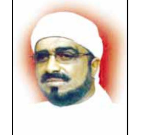
الشيخ / أنيس الحبشي