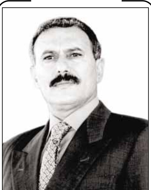
لحج / عادل محمد قائد

أكدت منظمات المجتمع المدني والشخصيات الوطنية والاجتماعية والمشائخ والأعيان والاتحادات الشبابية والإداعية والأندية الرياضية بمحافظة لحج تسامحاً وبخامسة القائد الجودي والوطني الأخ الرئيس/ علي عبدالله صالح كمرشح للرئاسة وانتخابه مجدداً نظراً لما يتحلى به فخامته من حكمة وصفات وطنية وإنسانية وكشخصية فذة تتطلبها المرحلة القادمة لبناء اليمن الحديث ولإزالة عجلة التنمية الاقتصادية والسياسية والاجتماعية ومواكبة التطورات الدولية والإقليمية التي يشهدها عالمنا اليوم. وتناشدت الحشود التي شاركت في الحفل فخامة القائد الوطني المناضل/ علي عبدالله صالح ورئيس الجمهورية العدول عن قراره عدم ترشيح نفسه للرئاسة في الانتخابات القادمة. وكان الأخوان في حيدرة ماطر أمين عام المجلس المحلي في لحج ومحسن النقيب وكيل المحافظة ورئيس المؤتمر الشعبي قد القيا كلمتين حيا فيها روح المخابرة والإصرار التي جسدتها هذه المنظمات والاتحادات والمشائخ والأعيان والشخصيات الوطنية والاجتماعية والمرأة في محافظة لحج أسوة بنظيراتها في محافظات الوطن مطالبة فخامة الأخ المناضل الجودي الرئيس بالعدول عن قراره عدم ترشيح نفسه في الانتخابات الرئاسية القادمة. وأكد النقيب ماطر إن قيادة السلطة المحلية بالمحافظة لن تالوا جهداً في رفع هذه المناشدة لفخامة الأخ الرئيس/ علي عبدالله صالح العمل بالعدول عن قراره نزولاً لفعاليتها من تجاه الرغبة الشعبية الجامحة هذه. هذا وتحلل فاعليات اللقاء قرابة برقيتي تضامان من محافظتي أبين والضالع بهذه المناسبة والقاء عدد من القضاة الوطنية العبرة عن مكانة فخامة الأخ الرئيس في قلب مواطني لحج خاصة والجمهورية عامة. حضر اللقاء عدد من الوكلاء المساعدين ومدراء عموم المديريات .