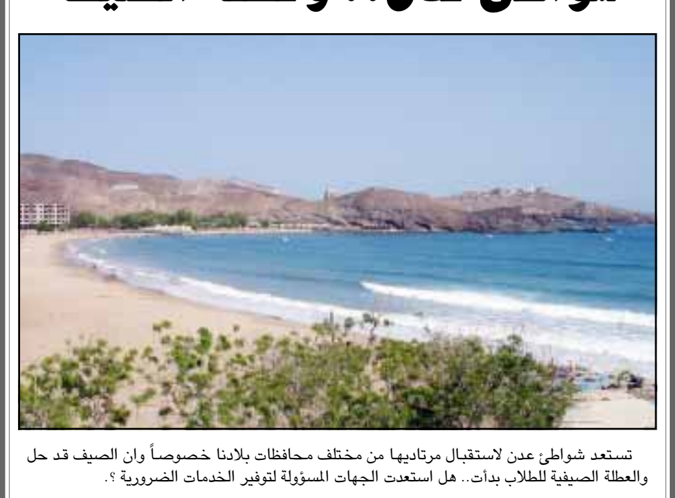
تستعد شواطئ عدن لاستقبال متزائريها من مختلف محافظات بلادنا خصوصاً وأن الصيف قد حل والعطلة الصيفية للطلاب بدأت.. هل استعدت الجهات المسؤولة لتوفير الخدمات الضرورية؟