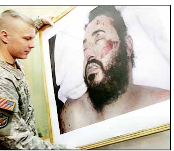
بغداد / سبا / وكالات: أعلن رئيس الحكومة العراقية نوري المالكي صباح أمس مقتل زعيم تنظيم القاعدة في العراق أبو مصعب الزقراوي في غارة أمريكية مساء أول أمس بشمال بعقوبة في شمال بغداد. وأعلن المالكي في مؤتمر صحفي بالمنطقة الخضراء مقتل الأردني أبو مصعب الزقراوي، مشيراً إلى أن ذلك جاء نتيجة للتعاون المنظم الذي طلبناه من جهازينا الذين قدموا المعلومات وسهلوا العملية أمام قوات الشرطة والجيش والقوات المتعددة الجنسيات في توجيه تلك الضربة الدقيقة القاتلة. وأشار إلى أن العملية تمت في منطقة بناحية هيب شمال بعقوبة بمحافظة ديالى في شمال بغداد. وأضاف المالكي: هذه رسالة إلى كل أولئك الذين يتكبدون العنف والإرهاب أن يتوقفوا ويعودوا إلى ردتهم قبل فوات الأوان. واستردالة سلبية للذين يريدون استخدام الإرهابيين لتحقيق أهدافهم.. هذه رسالة لكل من كان يمشي على نهج الزقراوي، مؤكداً أن المعلومات جاءت قائد عمليات الإرهاب. هذه خطوات للوصول للنهية السعيدة. واعتبر المالكي تصفية الزقراوي رسالة إيجابية للشعب العراقي والتماكس والبحث عن الأساليب السلمية في الصوار من أجل الوحدة. العراقيون جميعاً في مركب واحد وينبغي التتمة ص 2