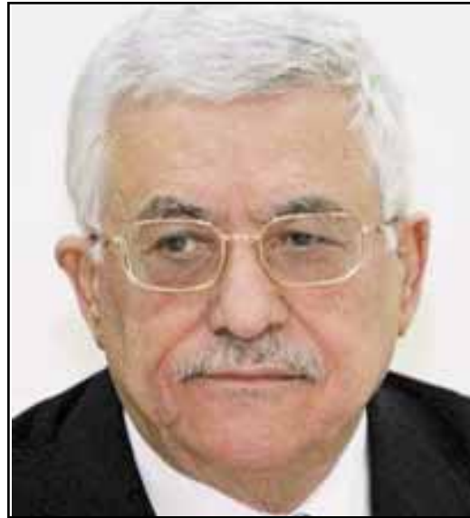
صنعاء / سبأ

جرى مساء أمس اتصاليان هاتفيين بين فخامة الرئيس عبد الله صالح رئيس الجمهورية وأخيه محمود عباس / أبو مازن/ رئيس السلطة الوطنية الفلسطينية وخالد مشعل رئيس المكتب السياسي لحركة حماس. وجرى خلال اتصاليين بحث تطورات الأوضاع في الساحة الفلسطينية وسبل تحقيق الوفاق الفلسطيني في ضوء ما يدور