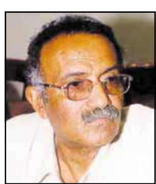
صنعاء / متابعات: