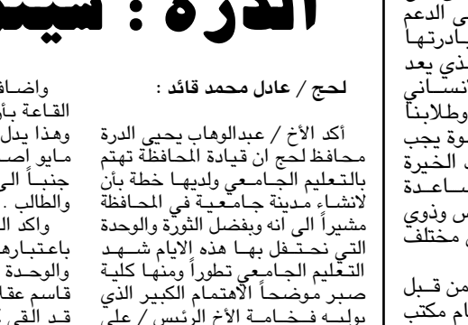
صنعاء / سبأ

حياتي وطالبات كلية التربية صير جامعة عن رسالة مناشدة لفخامة الأخ الرئيس / علي عبدالله صالح بإنشائه فيها بالعدل على قراره بعدم ترشيح نفسه للانتخابات الرئاسية القادمة وطالبونه بقبول دعوتهم للتشريع لمواصلة المسيرة والاستمرار في بناء التنمية الحديثة .