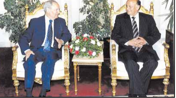
صنعاء / سبأ