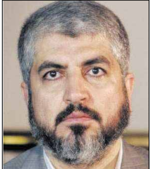
صنعاء / سبأ

حول الحوار الذي دعا إليه المجلس التشريعي الفلسطيني ، والتباين في وجهات النظر بين رئيس السلطة الفلسطينية وقيادة حركة حماس بشأن الاتفاق على الوثيقة المقدمة من الأسرى الفلسطينيين في السجون الإسرائيلية . وقد أكد فخامة رئيس الجمهورية مجدداً أهمية الحوار الفلسطيني - الفلسطيني ، ولما من شأنه تحقيق الوفاق وتعزيز وحدة الصف الوطني الفلسطيني. وناشد الرئيس قيادة حركة حماس بالموافقة على وثيقة الأسرى