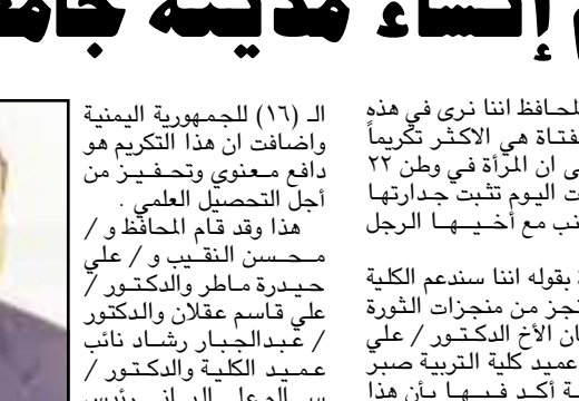
صنعاء / سبأ

وأضاف المحافظ اننا نرى في هذه القاعة بان الفتاة هي الأكثر توكيماً وهذا يدل على أن المرأة في وطن ٢٢ مايو أصبحت اليوم تثبت جدارتها جنباً إلى جنب مع أخينها الرجل والطالب . وأكد الدرقة بقوله اننا سندعم الكلية التكميلية والتعليمية والتمتع في جامعة عن موضحاً بأن الكلية مركز إشعاع علمي للمجتمع وهذا أبناء الطلاب والطالبات على هذا التكرم ، كما تطلخ الحفل قصيدة بعنوان ( بين الحضارة ) للطالبة / نسيم / كما القيت كلمة الطلاب المكرمين هناك في مستهلها فخامة الأخ الرئيس / علي عبدالله صالح بالعيد