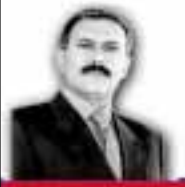
علي عبد الله صالح رئيس الجمهورية