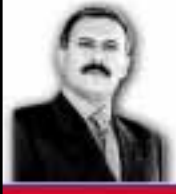
علي عبدالله صالح رئيس الجمهورية