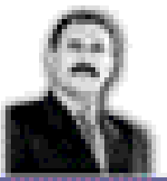
علي عبدالله صالح رئيس الجمهورية