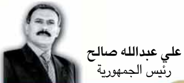
علي عبدالله صالح رئيس الجمهورية