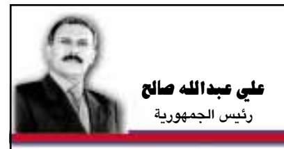
علي عبدالله صالح رئيس الجمهورية