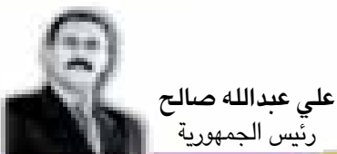
علي عبدالله صالح رئيس الجمهورية