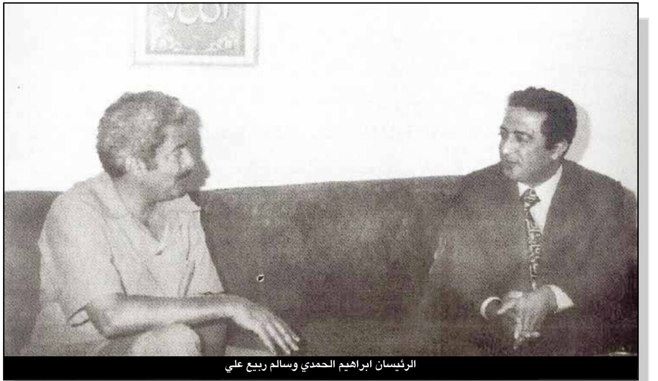
الرئيسان ابراهيم الحمدي وسالم ربيع علي