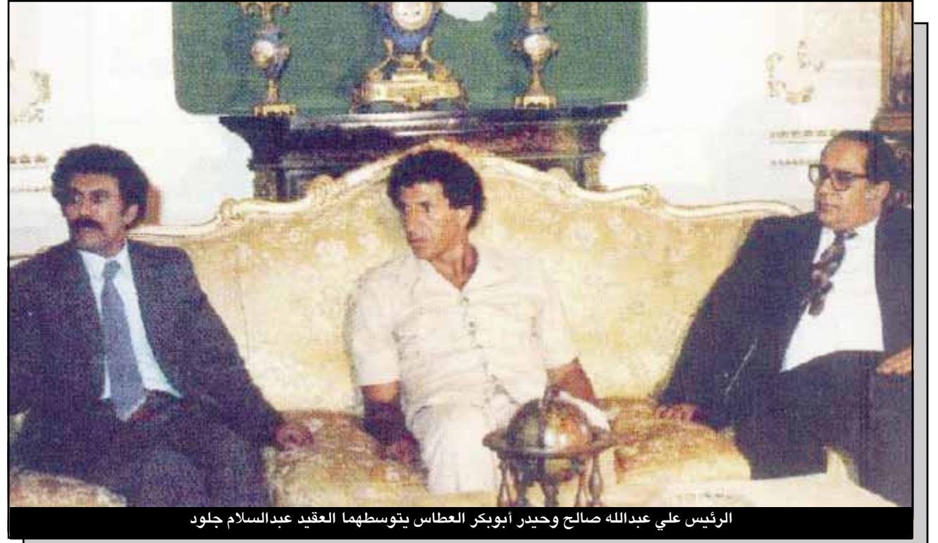
الرئيس علي عبدالله صالح وحيدر ابوبكر العباسي يتوسطهما العقيد عبدالسلام جلود