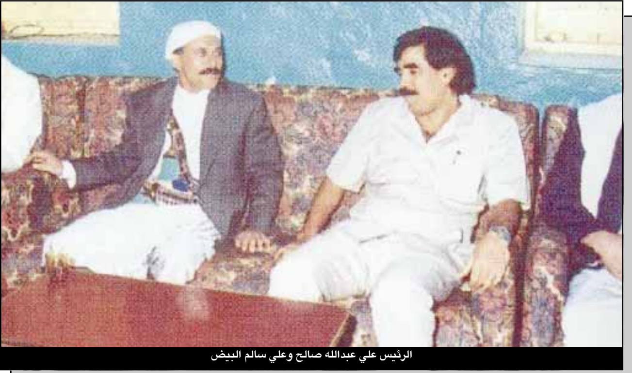
الرئيس علي عبدالله صالح وعلي سالم البيض