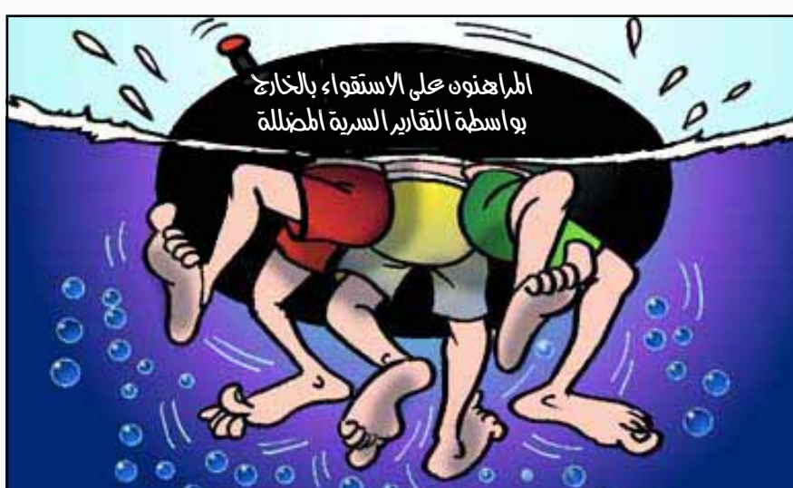
المراهنون على الاستقواء بالخارج بواسطة التقارير السرية المضللة

برلين / متابعات: كشفت موقع عالمي بيت أخباره وتقاريره من ألمانيا عن مغالطات أقدمت عليها أحزاب معارضة يمنية وأعوانها بالخارج بفبركة استطلاع للرأي بتعمد قلب الحقائق في محاولة لتشويه صورة الرئيس علي عبدالله صالح رئيس الجمهورية وحكومة المؤتمر الشعبي العام . وذكر الموقع العالمي (أخبار الغد) في تقرير مطول نشر أمس الأول السبت أن الاستطلاع الذي زعمت أحزاب (( اللقاء المشترك )) أن منفذه (مركز الراصد الإعلامي) احتوى مغالطات مفضوحة ، تبين زيفها من خلال تاريخ تنفيذها (٢٠٠٤/٣/١٠م - ٢٠٠٤/٥/١٤م) فيما كانت القضايا التي شملها حدثت في عام ٢٠٠٥م و٢٠٠٦م أبرزها إعلان الرئيس علي عبدالله صالح عدم ترشحه نفسه في الانتخابات الرئاسية المقبلة والتغيير الحكومي الذي تم في فبراير من عام ٢٠٠٦م. وفيما يلي تعيد «١٤ أكتوبر» نشر النص الكامل للتقرير الذي نشره موقع (أخبار الغد) تحت عنوان: (المعارضة اليمنية تفبرك استطلاعاً لتشويه صورة الرئيس صالح في الخارج): رغم قصر المدة التي كشفت فيها بعض المنظمات الدولية فضيحة التقارير السرية التي كانت تدعيها بها المعارضة اليمنية ممثلة بأحزاب اللقاء المشترك الذي يضم التجمع اليمني للإصلاح والحزب الاشتراكي اليمني والتنظيم الحزبي الشعبي الناصري وحزبي الحق واتحاد القوى الشعبية ، وخصوصاً المعهد الديموقراطي الأميركي (NDI) ومؤسسة (IFES) الأميركية أيضاً ، حملت الأنباء الواردة من خارج الحدود وتحديداً من الولايات المتحدة الأمريكية أن استطلاعاً للرأي تم توزيعه هناك من قبل فروع تلك الأحزاب ومناصريها تحت مسمى مركز الراصد الإعلامي ، والاستطلاع يتناول الأداء الحكومي والشخصي للرئيس علي عبدالله صالح