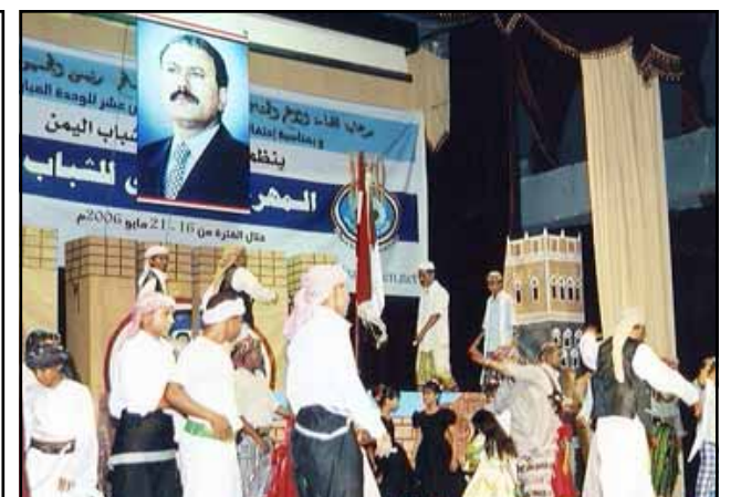
الحديدة / سبأ:

حضر فخامة الأخ الرئيس علي عبدالله صالح رئيس الجمهورية ومعه الأخ عبدربه منصور هادي نائب رئيس الجمهورية أمس احتفام فعاليات المهرجان الثاني للشباب الذي نظمه اتحاد شباب اليمن في مدينة الحديدة خلال الفترة من ١٧ إلى ٢١ من مايو الجاري في إطار احتفالات شعبنا بالعيد الوطني السادس عشر للجمهورية اليمنية. وقد تلقى فخامة الرئيس كلمة هنا فيها شباب اليمن بقيادة الاتحاد وعلى رأسهم معمر اليراني، على تنظيم مثل هذه المهرجانات التي تحول معظم المحافظات، وقال: « إن اتحاد الشباب بعضهم بعض يعد توطيداً للوحدة الوطنية، وإدراكاً قد حققنا الوحدة اليمنية الاندماجية بطرق سلمية فقد تعمتت بعد نهاية حرب الانفصال بفضل تلك الدماء الزكية الغالية التي روت