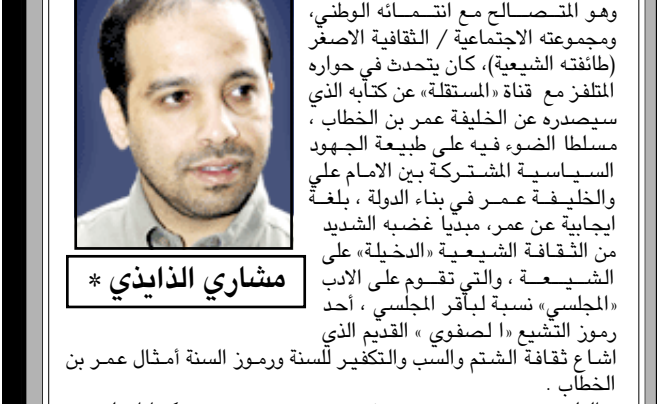
مشاري الذاذيني *

رأيت وسمعت الكاتب والسياسي العراقي حسن العلوي ، وهو يريد صرخة «سوار بن الضرب، احد الخوارج القدماء، هازنا من سلطة بني امية وتهديدهم : ابرجو بنو مروان سمعي وطاعني / وقومي تميم الفلاة ورباننا ! يرده العلوي ، المعارض المخضرم لصدام حسين ، وهو يفسر استمرارية تقدمه وتمرده على اهل الحكم في العراق - قائلان إنه لن يكف عن ابداء ملاحظاته النقدية عن العهد الجديد، وليس لديه قدرة على منعه ففلاة الارض وراه ، وهو ليس محبوساً في اقفاس الخارطة ... هو حليف الظلم العراقي ، لا الاحزاب ... او هكذا فهمته.