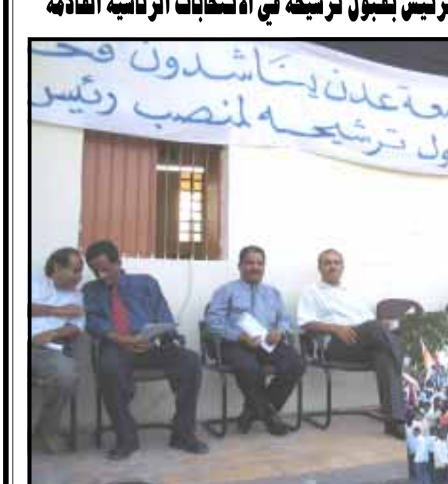
طالبات جامعة عدن يناشدون الرئيس بقبول ترشيحه لمنصب رئيس