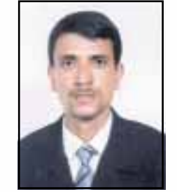
عبدالفتاح علي الجنوس

هاهي الايام تمر بسرعة وعقارب الزمن تسابق الريح معلنة عن بدء العد التنازلي لأسدال الستار عن انقضاء المرحلة الاولى لتجربة السلطة المحلية في نسختها الاولى والاستعداد للبدء في المرحلة الثانية التي تنطلق عقب الاعلان عن نتائج الانتخابات الرئاسية والمحلية المزمع اجراؤها في سبتمبر المقبل ، هذه التجربة الديمقراطية الفريدة التي تمثل ثورة جبارة في نظام الحكم المحلي على طريق حكم الشعب لنفسه بنفسه والقضاء على المركزية الادارية المعقدة وروتيتها المل . وتعميقاً لهذه التجربة ولتقييم مسار عملها ومستوى ادائها في مرحلتها الاولى تجري الاستعدادات على قدم وساق داخل اروقة وزارة الادارة المحلية لاتعداد المؤتمر العام الرابع للمجالس المحلية الذي من المقرر ان يعقد خلال الايام القليلة المقبلة عقب الاحتفال بالعيد الوطني السادس عشر ، ويتطلع الجميع ان يخرج المؤتمر بقرارات وتوصيات هامة من شأنها مواصلة البناء القوي لتجدير نظام الحكم المحلي واللامركزية الادارية واعطاء المجالس المحلية الصلاحيات الكاملة التي تمكنها من اداء عملها بصورة مثلى بعيداً عن الوصاية والتقييد ، وفي المقابل فرض رقابة صارمة على اداء المجالس المحلية وتفعيل عمل الهيئات الرقابية داخل هذه المجالس والبث السريع والفوري في القضايا المتعلقة بالتجاوزات والاختلالات التي رافقت عمل بعض المجالس المحلية وكانت محط اساءة لهذه التجربة الديمقراطية الفريدة ، ليلمس المواطنون الرودات الايجابية لتطبيق هذا النظام الذي كانت بلادنا نتطلع اليه الاخذ به سلوكاً وممارسة . وتتطلع دوماً نحو المزيد من مناحات الحرية وفسحات الديمقراطية الرحبة والواسعة التي تمثل ركيزة من ركائز البناء والتشييد في اي مجتمع كان .