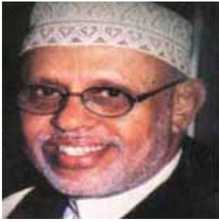
الفنان محمد مرشد ناجي

كان الصديق الشاعر الأستاذ لطفي جعفر أمان يختلف اختلافاً كبيراً عن غيره من الشعراء في عدني في تعامله مع الغناء.. وأهل الغناء.. فالشعراء الآخرون كانوا لا يكتبون الشعر للغناء وإذا كان من بينهم من يكتب الزجل، فإنه لا يكتبه من أجل ذلك أيضاً.. كالشاعر الأستاذ علي محمد لقمان ، وإذا لحن أحد الملحنين شعرهم ، أو زجل بعضهم - بإذن أو بغيره - فإنهم لا يلتفتون بالأول ، ولا اهتماماً ، إذا استثنينا من هؤلاء الشعراء الدكتور محمد عبده غانم صاحب الريادة في كتابة الزجل للغناء في عدني ( المستعمرة ) عند ظهور « ندوة الموسيقى الحديثة » وكان أحد المؤسسين لهذه الندوة ١٩٤٩م. واختلاف الأستاذ لطفي أمان عن زملائه الشعراء أنه كان يكتب الشعر ويكتب الزجل أحياناً من أجل الغناء وله رأي في هذا الاتجاه يجده القارئ في مكان آخر من هذا الموضوع.