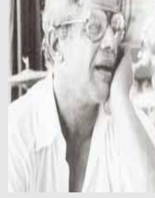
علي عبدالله صالح

وهو نفس المعنى الذي يكشف عن معنى الحب التليل حين تتوحد الآمال وتكون السعادة واحدة والهم واحد .. الألفاظ في سبب ضياع كل منا ويؤسسة وموجعة بكائه ، إنما نسعى لأجل أن نتحد أو لا ولو اتحدنا لما ارتقا الدعوى في سكنون الليل ، ولما نحننا كالتباديات في المات: ضاع عمري وأنا وحدي مايكوب وبيني شكى لويدك على يدي مايكوب وبيني شكى .. الخ