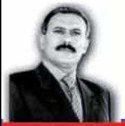
علي عبدالله صالح رئيس الجمهورية