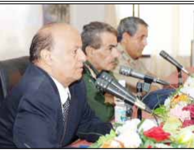
الرئيس علي عبدالله صالح رئيس الجمهورية حين يتم توجيه الجهود وتوحيدها لاستكمال البنى الأساسية للمطلوبات الضرورية للحياة وأهمها الطرقات والمياه والكهرباء والصحة والتربية والتعليم والاتصالات والتي تحققت فيها نجاحات ومكاسب كبيرة شملت مختلف محافظات الجمهورية وكل مديرياتها البالغة ثلاثاً وأربعين مديرية.

أكد الأخ عبد ربه منصور هادي نائب رئيس الجمهورية رئيس اللجنة العليا للاحتفالات على أن احتفالات بلادنا بالأعياد الوطنية، لم تعد احتفالات من أجل الاحتفاء فقط .. بل هي مناسبات تتحقق خلالها العديد من المنجزات والمكاسب والمشاريع التنموية والخدمية لصالح أبناء الشعب. جاء ذلك في المحاضرة الهامة التي ألقاها أمس أمام المشاركين في الدورة التثقيفية المشتركة لضباط التوجيه المعنوي في القوات المسلحة والأمن .. وتطرق الأخ نائب رئيس الجمهورية إلى تجربة إقامة الاحتفالات في المحافظات والإيجابيات الكبيرة التي تتحقق من خلال هذا التقليد الذي أرساه فخامة الأخ الرئيس علي عبدالله صالح رئيس الجمهورية حين يتم توجيه الجهود وتوحيدها لاستكمال البنى الأساسية للمطلوبات الضرورية للحياة وأهمها الطرقات والمياه والكهرباء والصحة والتربية والتعليم والاتصالات والتي تحققت فيها نجاحات ومكاسب كبيرة شملت مختلف محافظات الجمهورية وكل مديرياتها البالغة ثلاثاً وأربعين مديرية.