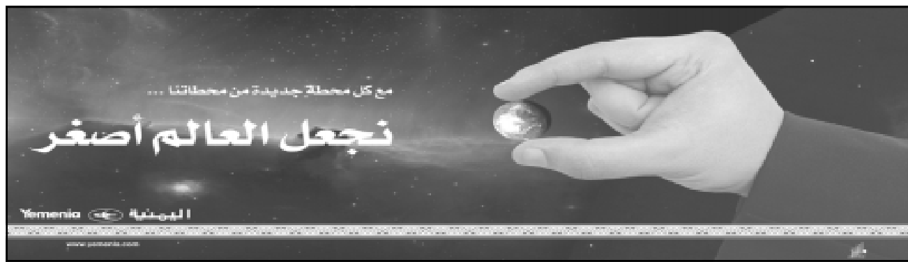
مع كل محطة جديدة من محطاتنا ... تجعل العالم أصغر