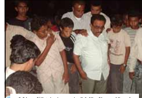
رئيس التحرير يلقي نظرة الوداع وبجواره ابن الفقيد وشقيقه