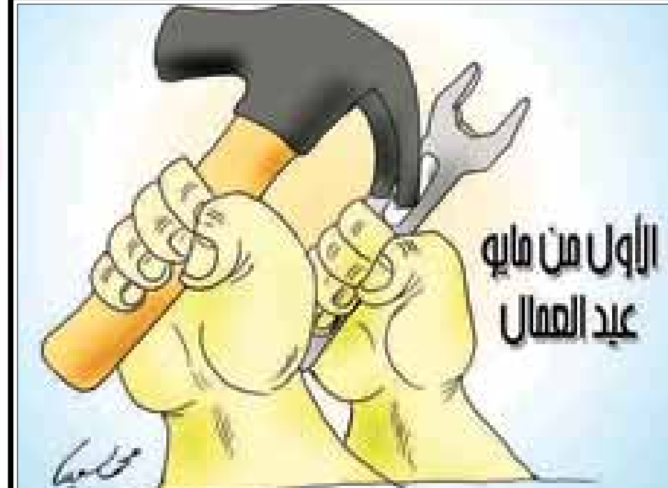
الاول من مايو عيد العمال