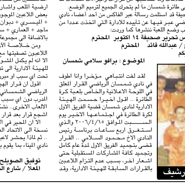
شمسان من اليريشاف

الادارة عاجلت الامور بطريقة لم تخلو من الشدة لكنها في الاخير اكتسبت الطابع التسريبي حتى وان تم تعليق قرارات صرامة الباب لايزال مفتوحا