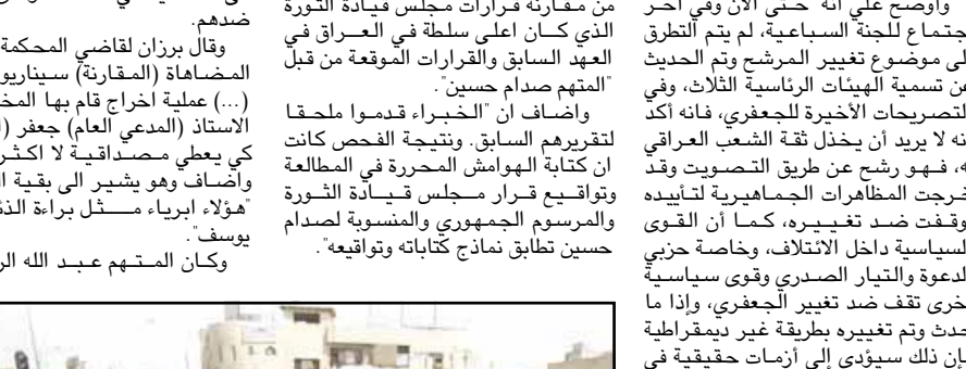
وقال متحدث عسكري امريكي ان ٥٠ مسلحا هاجموا القوات العراقية عند منتصف الليل في معركة دامت سبع ساعات قتل فيها خمسة مسلحين وجرح جندي عراقي واحتمد القتلى الى درجة جلب تعزيزات امريكية للمنطقة الواقعة شمالي بغداد.