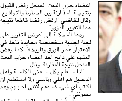
ويضع التمسحون الثمانية الذين يواجهون عقوبة الإعدام ببراءتهم وسعى برزان ابراهيم العبدى الاخ لا غير المشتبهين لصدام حسين واعداد آخر من المتهمين على التشكيك في صحة الوثائق المقدمة ضدهم.

وتجرى تظاهرات في البلاد منذ اسبوعين ضمن حركة احتجاج واسعة النطاق ضد تولى الملك جيانيندرا السلطات الكاملة في البلاد منذ فبراير ٢٠٠٥.