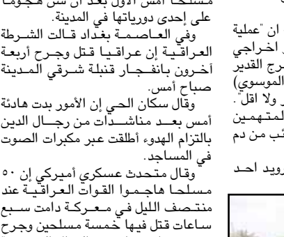
وقال متحدث عسكري امريكي ان ٥٠ مسلحا هاجموا القوات العراقية عند منتصف الليل في معركة دامت سبع ساعات قتل فيها خمسة مسلحين وجرح جندي عراقي واحتمد القتلى الى درجة جلب تعزيزات امريكية للمنطقة الواقعة شمالي بغداد.