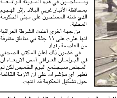
وقال متحدث عسكري امريكي ان ٥٠ مسلحا هاجموا القوات العراقية عند منتصف الليل في معركة دامت سبع ساعات قتل فيها خمسة مسلحين وجرح جندي عراقي واحتمد القتلى الى درجة جلب تعزيزات امريكية للمنطقة الواقعة شمالي بغداد.