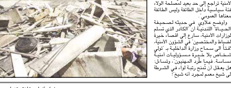
وقال متحدث عسكري امريكي ان ٥٠ مسلحا هاجموا القوات العراقية عند منتصف الليل في معركة دامت سبع ساعات قتل فيها خمسة مسلحين وجرح جندي عراقي واحتمد القتلى الى درجة جلب تعزيزات امريكية للمنطقة الواقعة شمالي بغداد.