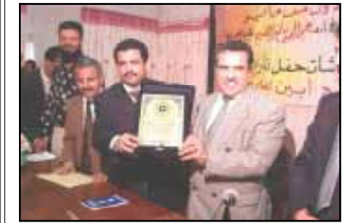
عدن/ إصلاح العبد

أقيم صباح أمس في ديوان محافظ محافظة عدن حفل تكريم عدد من المحالين للتقاعد من موظفي الهيئة العامة للتأمينات والمعاشات لغروبها عدن - لحج - أبين للعام ٢٠٠٦م.