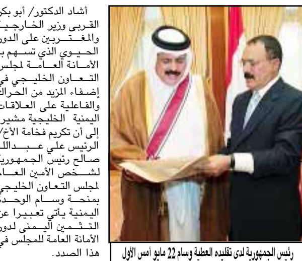
رئيس الجمهورية لدى تقبله العظة وسام 22 مايو ايس ال اول هذا الصد.

د. القريبي : تكريم فخامة رئيس الجمهورية لشخصية طبية تميزت عن غيرها لادوار الأمانة العامة لمجلس التعاون الخليجي