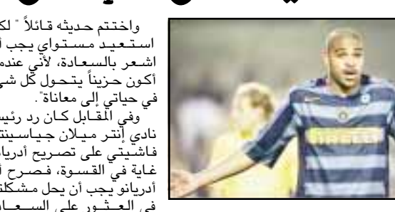
أدريانو في زي فريق إنتر ميلان.

سببت التصريحات، التي أدلى بها البرازيلي أدريانو مهاجم إنتر ميلان الإيطالي بعد هزيمة فريقه أمام الميلاق يوم الجمعة، ضجة كبيرة في أوساط كرة القدم الإيطالية. وكان أدريانو قد صرح لأحد البرازيليين في تصريحاته بعد المباراة التي انتهت لصالح الميلاق بهدف نظيف، أنه صنع من توجيه اللوم إليه بعد كل نتيجة سيئة يحققها الفريق. وقال أدريانو "لقد سئمت من القاء اللوم علي بعد كل هزيمة، يجب أن يتشاور أعضاء الفريق جميعاً المسئولية في حالة الفوز أو الهزيمة". وأضاف إذا كانت جماهير الإنتر لا تريدني هنا فعليهم أن يطلقوا مني ذلك لقب رجعي، ولكن عليهم أن يعلموا أيضاً أن حبي لوان الإنتر سيظل دائماً في قلبي. وكان مستوى أدريانو الملقب بالإمبراطور من قبل جماهير الإنتر، قد هبط بشكل كبير في الفترة الأخيرة، فلم يستطع المهاجم البرازيلي أن يحرز سوى ثلاثة أهداف فقط منذ بداية العام الحالي. وفي تعقيبه على ما ذكرته بعض الصحف عن تشاجره بالأبدي مع الأرجنتيني خوان فيرون، زميله في الفريق، بعد لقاء فياريال الأخير في دوري أبطال أوروبا. صرح أدريانو "السوء الحظ هناك لحظات صعبة في الحياة تعرف فيها من هم أصدقائك الحقيقيين، وخلال الشهرين الماضيين مرت بأصعب أيام حياتي".