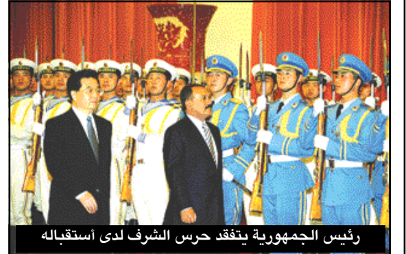
رئيس الجمهورية يتفقد حرس الشرف لدى استقباله