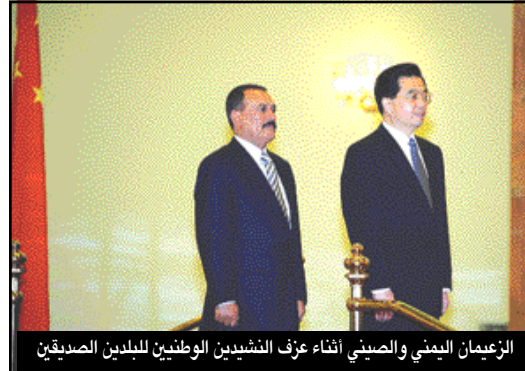
الرئيس الصيني يصفح الوفد اليمني أثناء عزف الموسيقي الوطني للبلدين الصينيين