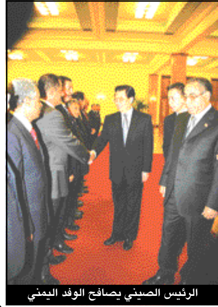
الرئيس الصيني يصفح الوفد اليمني