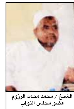
الشيخ / محمد محمد الروزم عضو مجلس النواب