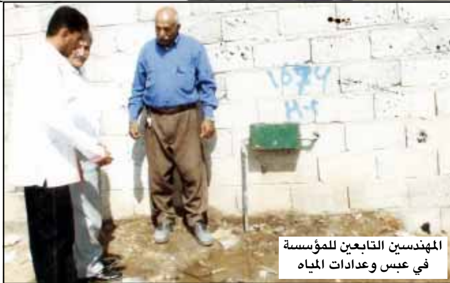
المهندسين التابعين للمؤسسة في عبس وعدادات المياه