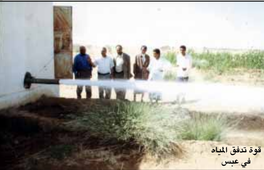
قوة تدفق المياه في عبس