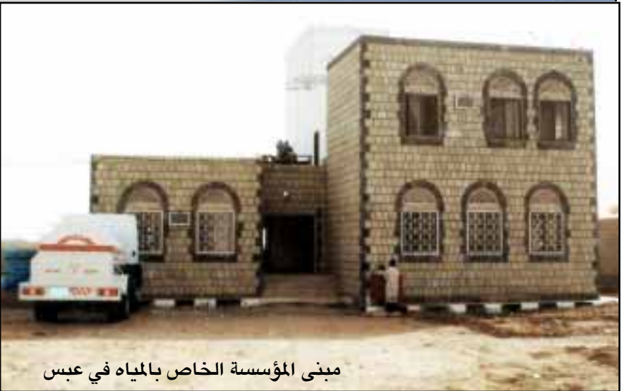
مبنى المؤسسة الخاص بالمياه في عبس