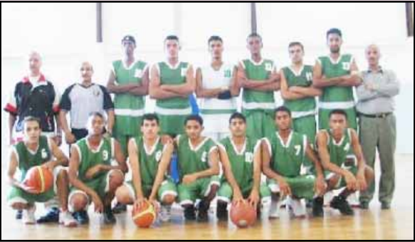
لهم مستقبل باهر بغان الله خلال السنوات القادمة بما لديهم من امكانيات فنية وبنية عالية.

نهائيات آسيا التي تحتضنها الصين في شهر سبتمبر القادم. ويعني اخبرك ان منتخبنا يحتاج إلى فوزين فقط كي يتمكن من التواجد في نهائيات الصين للمرة الرابعة على التوالي بعد ان تأهل منتخب الناشئين إلى النهائيات ثلاث مرات سابقة أولاها في ماليزيا عام ٢٠٠٠م، والثانية في الكويت عام ٢٠٠٢م، والثالثة في الهند عام ٢٠٠٤م .