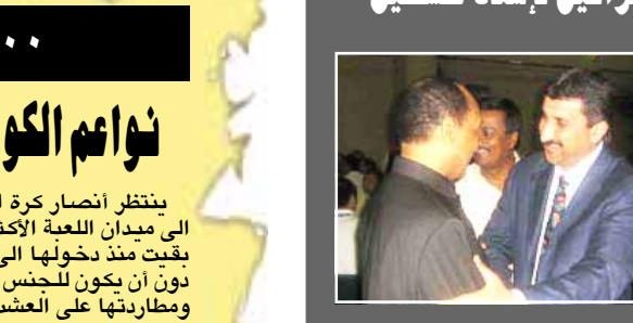
استنكر سعادة محمد من همام

العدد الله رئيس الاتحاد الآسيوي لكرة القدم - تصف إسرائيل الإستراتيجية الإسرائيلية لإسناد فلسطين الكروي الدولي بمدينة غزة بالصواريخ الثقيلة والتي أحدثت دماراً في أرضية الملعب حيث أكد أن هذه الممارسات تتعارض مع الروح الطيبة التي تغرسها الكرة بين الشعوب . وشدد سعاده على أنه سيقوم بمخاطبة الاتحادات القارية والعربية بهذا الشأن لفضح هذا العدوان الجديد الذي عاد ليستهدف المنشآت الرياضية . وأشارت تصريحات بن همام هذه خلال لقاءه ناهض الهور أمين سر الاتحاد المساعد ورئيس اللجنة بحضور جوزيف بلاتر رئيس الاتحاد الدولي ، حيث قدم الهور شرحاً مفصلاً عن الصعوبات والتحديات التي تواجهها الكرة الفلسطينية جراء الممارسات الإسرائيلية وكذلك عملة القصف للملعب التي وقعت مرتين خلال أقل من يومين .