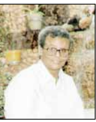
كلمات : صالح مهدي بن علي لحن وغناء : محمد عبده زبيدي