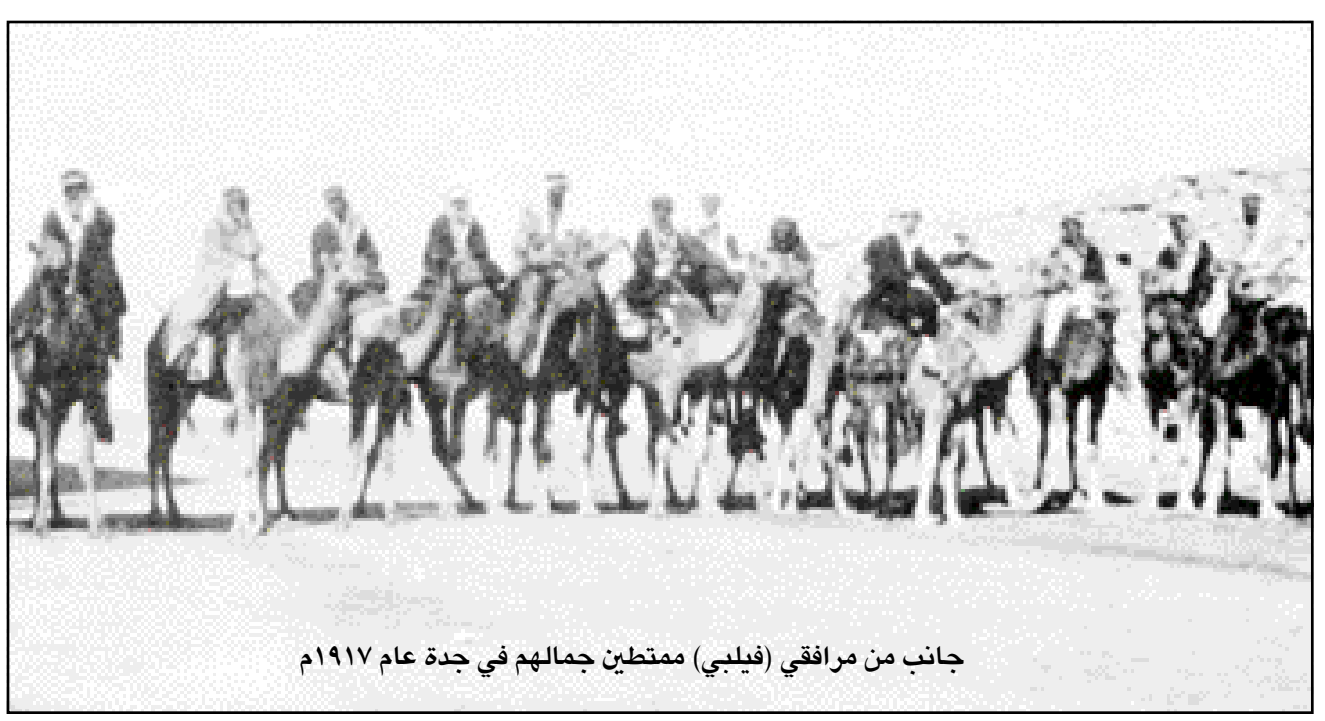
جانب من مرافقي (فيلبي) ممتطين جمالهم في جدة عام ١٩١٧م

كان ميلاده عام ١٨١١م في جزيرة أولاند الفنلندية حيث عمل أبوه في محكمته وفي عام ١٨١٧م دخل مدرسة الكنيسة وبعد أن أنهى دراسته الثانوية دخل جامعة هلسنكي عام ١٨٢٩م وحصل على الدكتوراة متخصصاً باللغات الشرقية وذلك في عام ١٨٢٩م وكان موضوع بحثه الفارق بين اللغة العربية الفصحى والعامية ، وفي خريف عام ١٨٤١م تقدم بطلب الى جامعة هلسنكي من أجل حصوله على منحة دراسية لمدة خمسة سنوات للقيام برحلة الى مصر والجزيرة العربية . وبتاريخ ٢٨ يوليو ١٨٤٢م غادر هلسنكي وذهب الى هامبورغ وباريس ومرسيليا واستانبول ، ووصل الى الاسكندرية بتاريخ ١٥ ديسمبر ١٨٤٢م وغادر الى القاهرة يوم ٢٩ يناير ١٨٤٤م وغادر القاهرة يوم ١٢/٢٠/١٨٤٥م مع مرشد بدوي عبر سيناء نحو نجد وأول منطقة وصل إليها في شمال الجزيرة العربية هي الجوف وكان ذلك بتاريخ ٥/٥/١٨٤٥م وأقام فيها حتى تاريخ ١٨٤٥/٨/٢٠م وبعد ذلك سافر الى حائل عبر النفوذ والتي وصل إليها يوم ١٩٤٥/٩/٢٠م وبقي فيها مابقر من ١٠ يوماً وكان ضيفاً لمدة ستة أيام على الأمير عبدالله بن رشيد وبعد تلك الفترة الرسمية التي قضاه في حائل غادر مع قافلة حج الى المدينة المنورة وزار قبر الرسول (ص) ومكة وأدى فريضة الحج ثم عاد الى مصر ليضع خطه للعودة من جديد الى الصحراء العربية وفي القاهرة قضى بعض الوقت بتبادل الرسائل مع جامعته من أجل أن تدفع له بعض المال لإكمال مشروعه ، والاستعداد