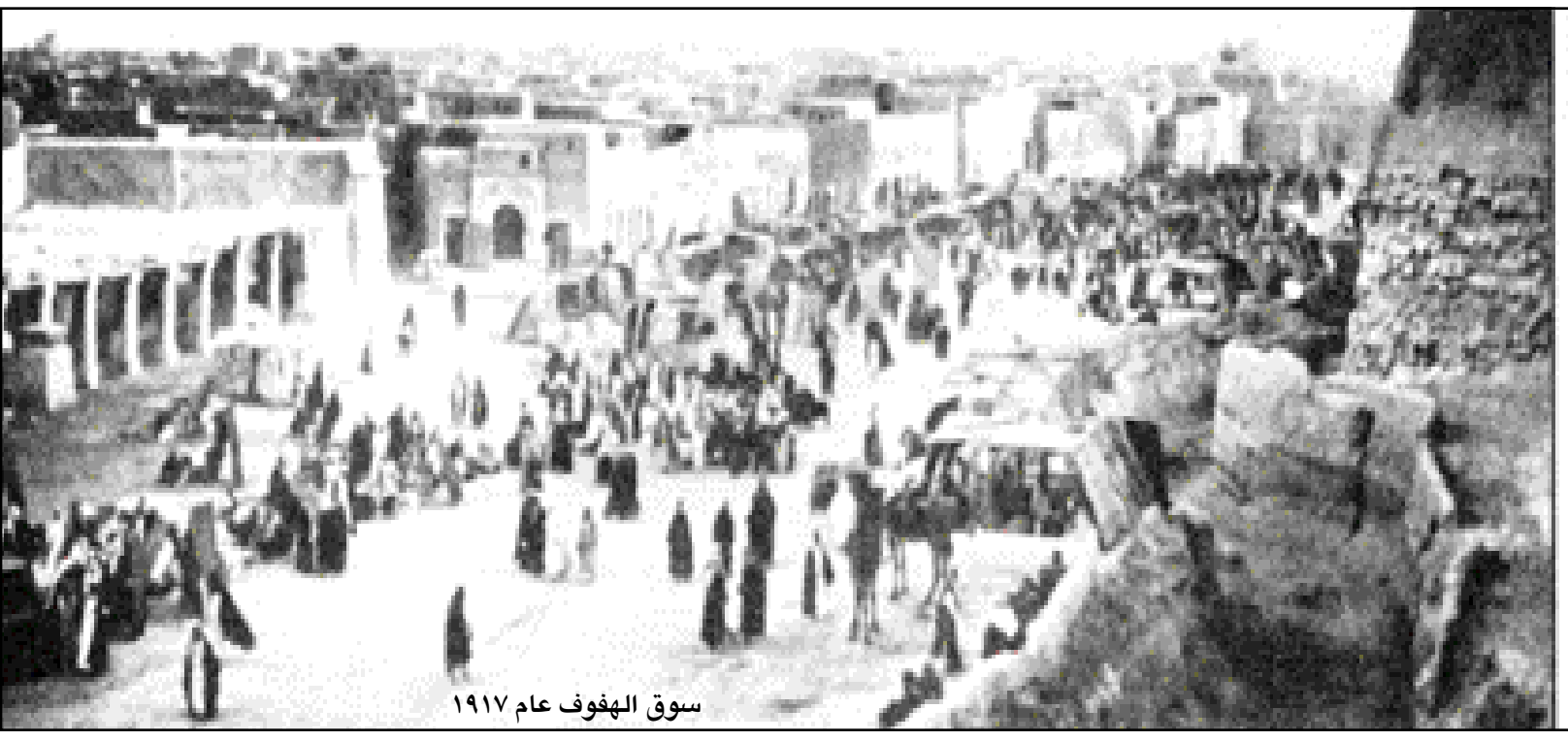
سوق الهفوف عام ١٩١٧

تاريخ الرحلات الأوروبية الى جزيرة العرب يعود الى الاعوام ١٤٧٦ و ١٤٩٠م عندما زار الرحالة كابوت مكة ، وكان ملك البرتغال جان قد أرسل الى الجزيرة العربية عام ١٤٨٧م بدور دي كوفيلهما والذي كان يجيد التحدث بالعربية بهدف التحقق من إمكانية العبور الى الهند عبر البحر الاحمر وقد مر بعدة مناطق حتى وصل الى عدن ومنها الى بلاد الهند ، أما رحلة نيبور التي كانت عام ١٧٦١م الى بلاد العرب فقد اعتمدت كأول رحلة علمية تصور الى هذه البلاد وبعدها جاءت رحلة الألماني ستينزن والذي ادعى الاسلام وحج عام ١٨١٠م ورسم أول مخطط للمدينة المنورة وفي عام ١٨٠٦م جاء الرحالة الإسباني دومنغو بادليا والذي عرف باسم الحاج علي بك العباسي وشاهد موكب الامام سعود بن عبدالعزيز في مكة أما بركهارت السويسري مؤلف كتابي "رحلة الى بلاد العرب" و "ملاحظات عن البدو" قد زار الحجاز عام ١٨١٤م. نجمي عبدالمجيد