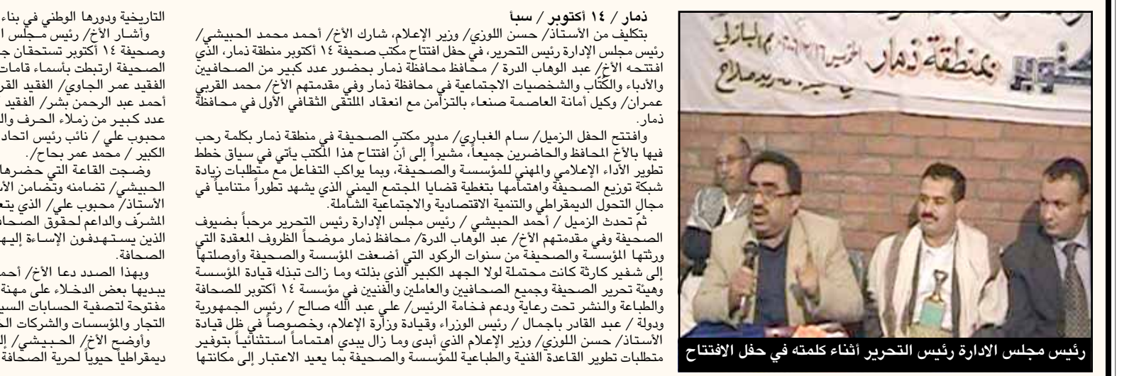
رئيس مجلس الإدارة ورئيس التحرير أثناء كلمته في حفل الافتتاح