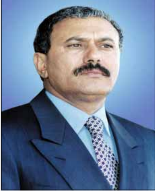
أكد أن فخامة الرئيس/علي عبدالله صالح استحق وبجدارة لقب زعيم الأمة وتم اختياره كأبرز شخصية عالمية لعام 2006 بإجماع أعضاء المجلس الذين يرون في فخامته أتمونجاً للقائد الملتزم بالدفاع عن قضايا أمته والحفاظ على هويتها وبما يعزز من مكانتها بين الأمم.

وأضاف المستشار مجدي مرجان، رئيس المنظمة أن الرئيس/علي عبدالله صالح، استطاع إعادة تحقيق الوحدة في ظل زمن التشرد والتفوق العربي وبذلك جسدت الوحدة اليمنية أمل الأمة في التكامل والتوحد، ومثل فخامة الرئيس/علي عبدالله صالح القائد الأواحد الذي يمكنه تحقيق تطورات الشعوب في تعزيز وحدة الصف العربي وإعلاء مكانة الأمة في الأسرة الدولية. ونوه إلى أن اليمن شهد في عهد فخامة الرئيس/علي عبدالله صالح نهضة تنموية شاملة حيث استطاع فخامته أن يخلق اليمن من دولة ضعيفة إلى دولة حضارية رائدة في شتى المجالات السياسية والاقتصادية والاجتماعية والتنمية وحقق لليمن ما لم يستطع تحقيقه الأوائل وفي الصدارة تحقيقه للوحدة اليمنية وديفاعة عنها إلى جانب ترسيخ النهج الديمقراطي وإقرار التداول السلمي للسلطة عبر الانتخابات الحرة النزهاء التي تعد مفخرة لكل دول المنطقة.