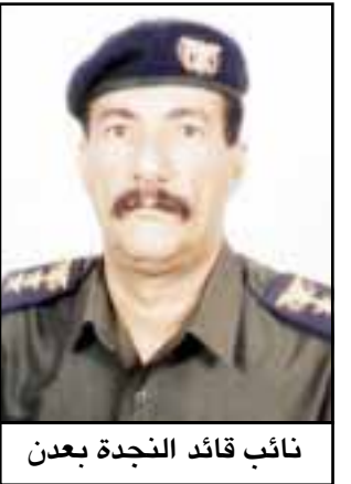
نائب قائد النجدة بعدن