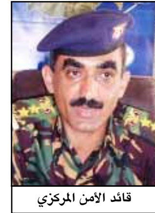
قائد الأمن المركزي

إستطلاع/ أحمد علي مسرع / عيروس نوري ت/ جان عبد الحميد/ علي محمد فارغ