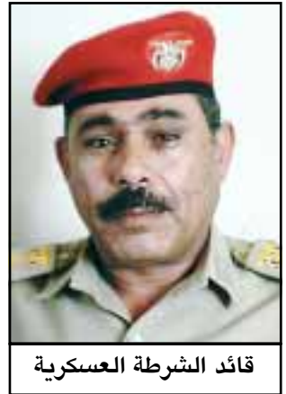
قائد الشرطة العسكرية