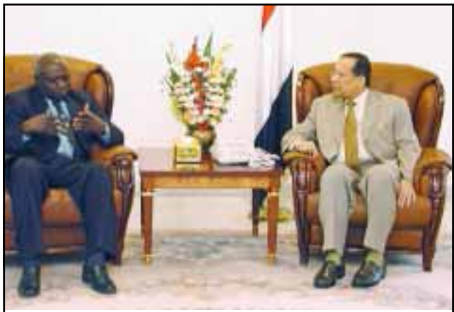
رئيس الوزراء يلتقي المدير العام لمنظمة (الفاو)