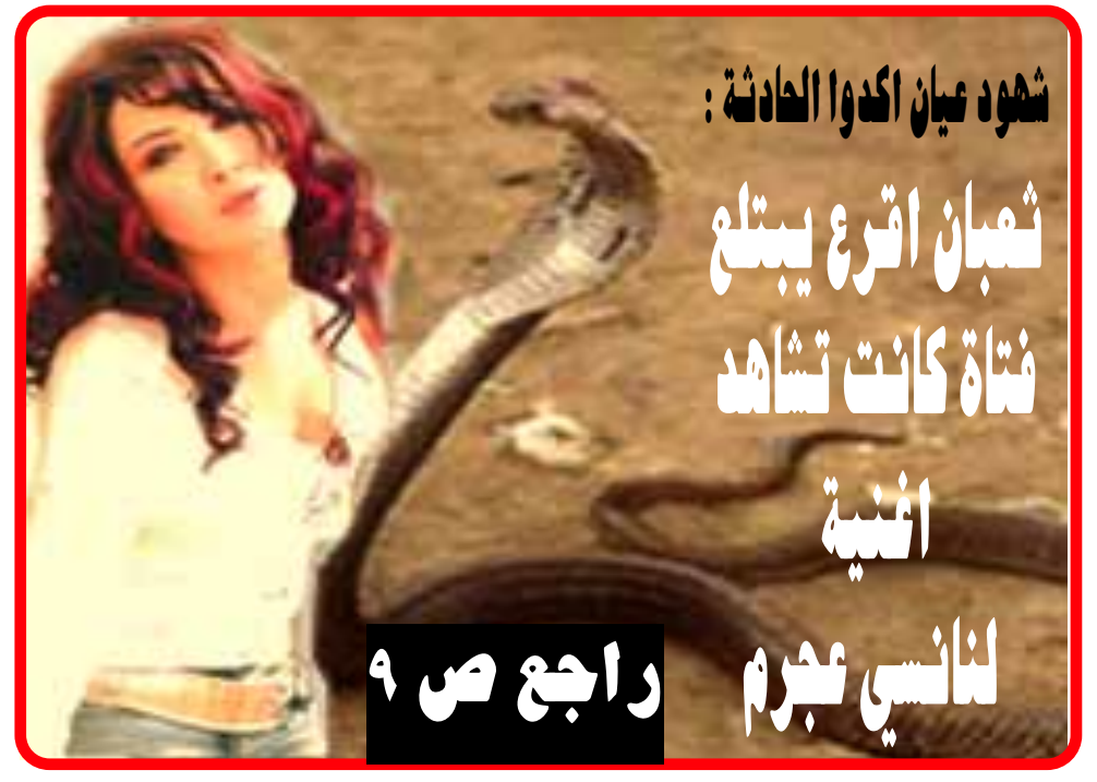
شهود عيان اكدوا الحادثة : ثعبان اقترع يبتلع فتاة كانت تشاهد ائنية لنانسي نجوم راجع ص ٩