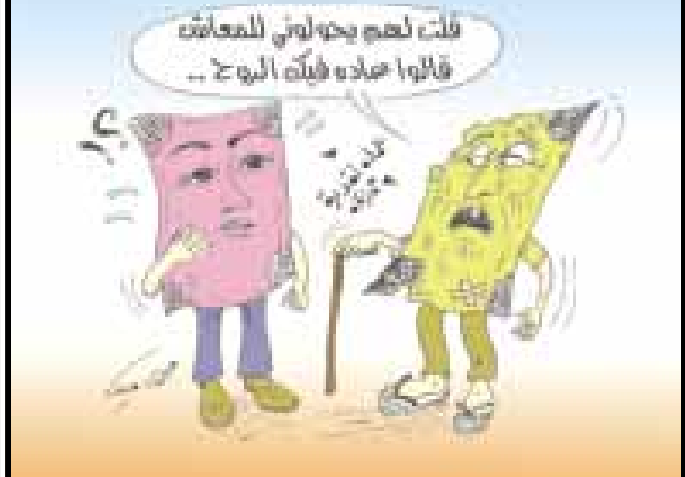
قلت لعمو يحولني للمعات قالوا حياك حياك الويح ..