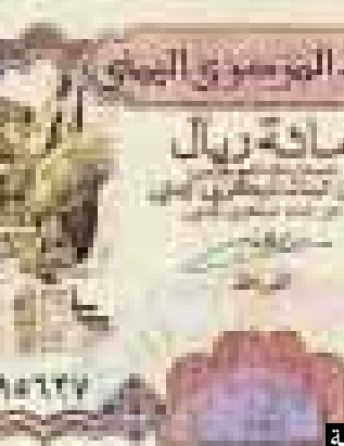
صهاريج عدن على العملة اليمنية