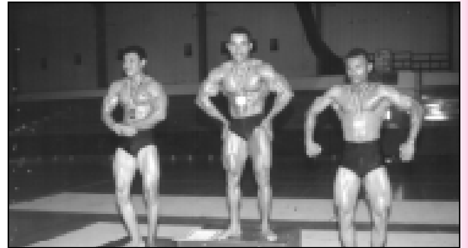
متابعة/ فرحان المنتصر

غداً.. انطلاق بطولة الجمهورية لبناء الأجسام في عدن الثلاثاء ١٤ أكتوبر: نتمنى ان تقدم الأندية مستوى يعكس التطور الذي وصلت إليه اللعبة.