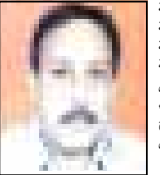
التعازي الحارة بهذا المصاب الجليل .