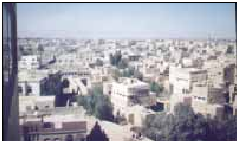
عمران / طارق الخميسي

أكثر من ( ٢٢٣ ) مليوناً و ( ٥٠٠ ) ألف ريال الإيرادات المحققة للعام الماضي ٢٠٠٥م