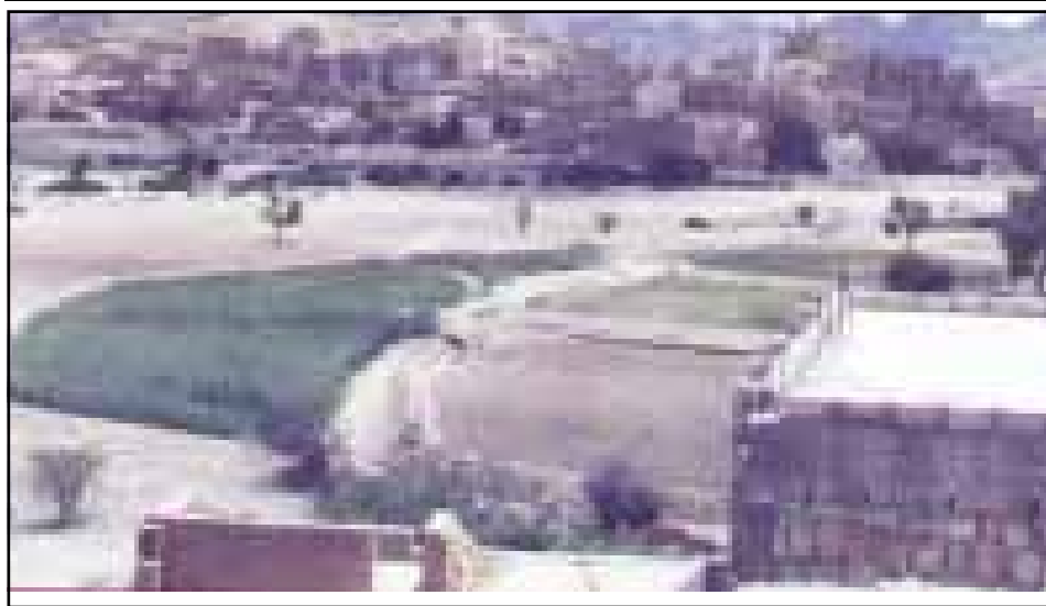
شوة / سبأ

تستهدف مؤشرات الخطة الخمسية الثالثة للتنمية والتخفيف من الفقر في محافظة شوة للأعوام ٢٠٠٦-٢٠١٠، استكمال مشروعات البنية التحتية والمرافق الخدمية واستقطاب الاستثمارات العامة والخاصة لتنمية النشاط الاقتصادي والاهتمام بالتنمية البشرية والتخفيف من الفقر، وكذا تشجيع وترسيخ المشروعات والصناعات المرتبطة بالثروات النفطية والغاز الطبيعي والمنتجات الزراعية والسياحة ورعاية النشء والشباب والمرأة كمتصرف فاعل في المجتمع .