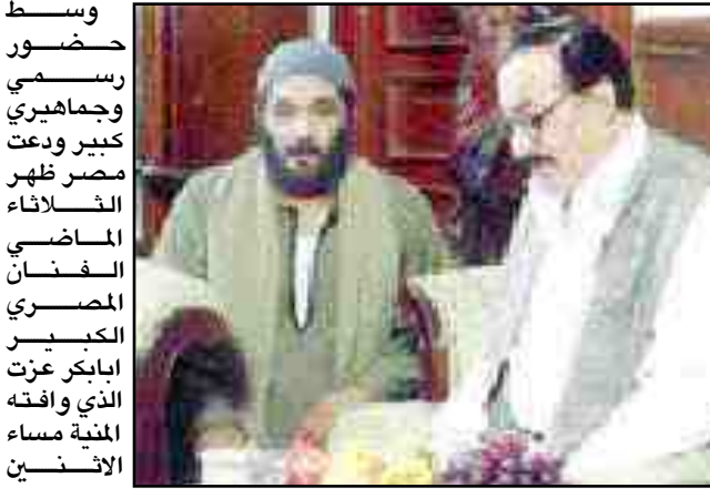
وسط حضور رسمي وجماهيري كبير ودعت مصر لظهور الاختلاف الماضي الفنان المصري الكبير اياكيز عزت الذي وافته المنية مساء الاثنين

وكان عددا كبيرا من زملائه الفنانين المصريين في وداعه موشحين بهالات من الحزن العميق على فقده، ان تميز الراحل بعلاقته الطيبة بزملائه.. كما تميز بالهدوء الشديد ولم يدخل في اي صراع مع اي زميل له طوال حياته. وكان زاهدا بشكل كبير في الحوارات والإطالات الاعلامية، اوار وشخصيات متنوعة لدرجة ان حصل على جائزة مهرجان القاهرة السينمائي الدولي قبل عشر سنوات عن دور رجل نقلته زوجته لظلمه الشديد.