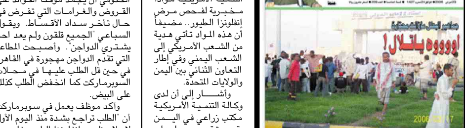
ملحن (١٤ أكتوبر الرياضي) في الأوق

وأشار إلى أن لدى وكالة التنمية الأمريكية مكتب زراعي في اليمن يقوم بتقديم مساعدات فنية واستشارية وعينية. بالإضافة إلى دعم صغار المزارعين في خميس محافظات في الجوف، مارب، صعدة، عمران، وشبوة.