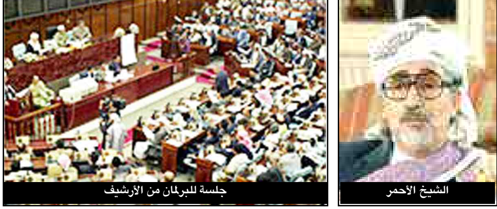
جلسة للبرلمان من الأرشيف

الإثنين القادم.. بدء محاكمة (17) متهماً من القاعدة بينهم (3) سوريين